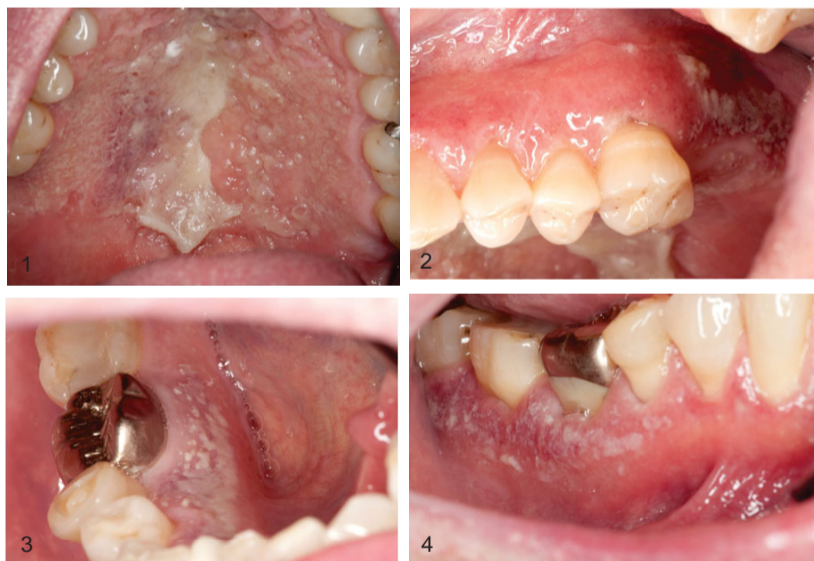
Abb. 1 – 4 Zustand nach 3-tägiger Spülung mit CHX