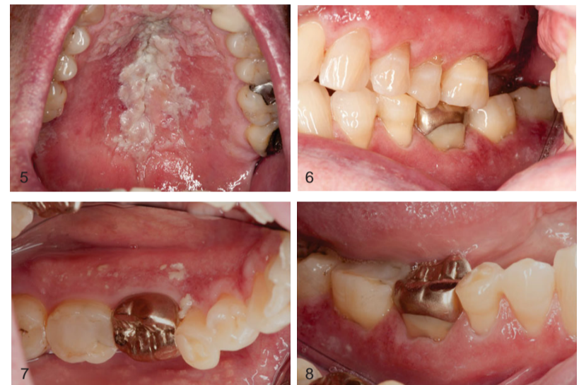
Abb. 5 – 8 Zustand zwei Tage nach Absetzen der Lösung

Innerhalb von zwei Tagen war die Veränderung deutlich rückläufig, die Pseudomembran löste sich weitestgehend, das Erythem der Gingiva verblasste (Abb. 5 - 8) und nach einer Woche stellte sich eine Restitudo ad integrum ein (Abb. 9 und 10).